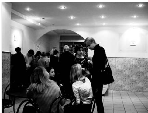
«Быстрая перемена» в школе № 1158 ЮАО, г. Москва

Сегодня нам хотелось бы обсудить вопрос, связанный с установкой в школьной столовой такой технологической конструкции, как барная стойка: что это — дань современной моде или всё же элемент развития культуры питания у детей?