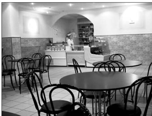
Кафе в школе № 1158 ЮАО, г. Москва

Совершенствование системы охраны здоровья детей в общеобразовательных учреждениях, формирование культуры здоровья и мотивация здорового образа жизни стали сегодня важнейшими задачами в деятельности Министерства здравоохранения и Министерства образования РФ.