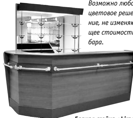
Барная стойка «Lira»

Возможно любое цветовое решение, не изменяющее стоимость бара.