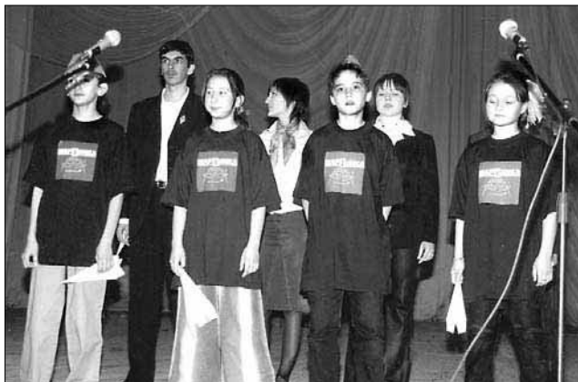
Современная агитбригада «Блок-Ада» против наркотиков, объехавшая со своими выступлениями всю область

С 1990 года педколлектив занимается проблемой здоровьесбережения в условиях повышенного уровня обучения. Получив право на особый учебный план без ограниче-