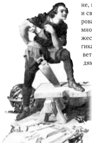
Худ. Д. Маклайз (Фрагмент)

Россия и Запад — вечная коллизия, опоясывающая нашу общественную жизнь с незапамятных времён. Нужно помнить, что возвышение нашей страны, превращение