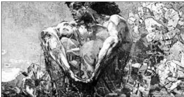
М. Врубель. «Демон»

по Лэннингу, были англо-американцами) заслуживают почтения. Он по праву гордится своим поколением американских военных, которые «остались в армии после Вьетнама, чтобы реорганизовать армию, восстановить её престиж на Родине и в мире, способствовать тому, что США стали единственной сверхдержавой в мире». Наши идеологи предпочитают замалчивать правду о тех, кто победил и проиграл в холодной войне, утешаясь демагогией о дружбе и союзнических отношениях. Лэннинг же не скрывает лидерских амбиций своего государства. Не скрывает он и искреннего торжества победителей в противостоянии двух миров: сильный имеет пра-