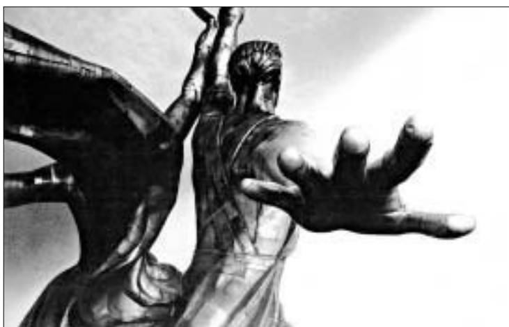
В. Мухина «Рабочий и колхозница»

Конечно, давным-давно пора ограничить присутствие иностранной продукции на телевидении, на радио, в кинотеатрах. По моему мнению, на закупку иностранного товара вообще следует решаться лишь в крайнем случае, если в нашей стране отсутствует производство данного вида продукции. В противном случае это — деградация, стыд и позор.