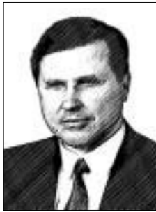
Олег Смолин, заместитель председателя Комитета Государственной Думы по образованию и науке, доктор философских наук

Российский социально-политический процесс породил по меньшей мере пять факторов внутреннего и внешнего (по отношению к политике в области образования, но отнюдь не образовательной политике в целом) характера, вызывавших дестабилизацию и угрожавших деструкцией российской системе образования.