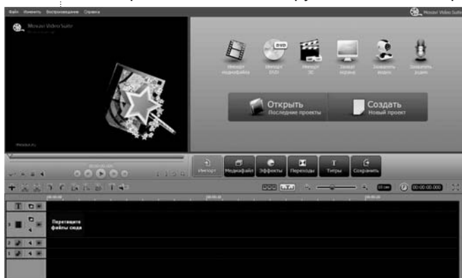
Рис. 2. Рабочее поле видеоредактора Movavi

• Добавить музыку : перетащить на аудиодорожку (она отмечена пиктограммой с изображением ноты) аудиофайл, который предусмотрен вашим сценарием и импор-