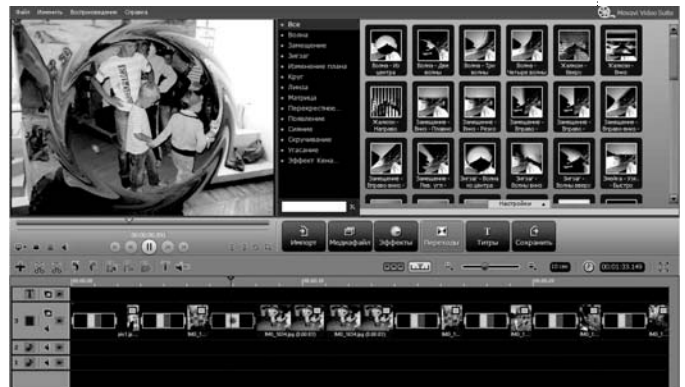
Рис. 4. Добавление переходов в видеоредакторе Movavi

• Сохранить видеоролик. Выбрать в меню Файл – Экспорт проекта – Сохранить как видеофайл . Выбрать нужный формат. Для загрузки видео в социальные сети или на YouTube подойдёт MPEG4 – универсаль-