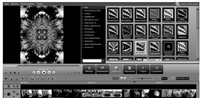
Рис. 6. Видеоэффекты в видеоредакторе Movavi