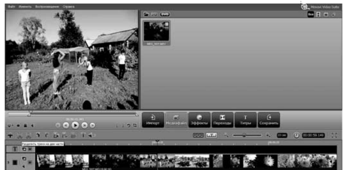
Рис. 5. Вырезание фрагментов в видеоредакторе Movavi