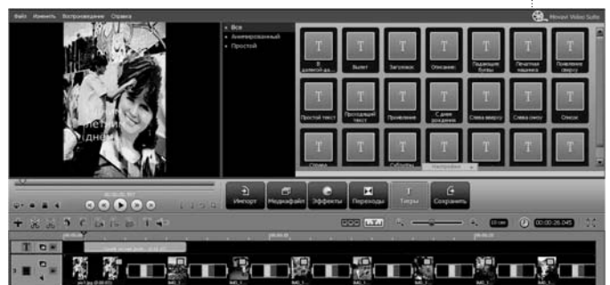
Рис. 7. Добавление титров в видеоредакторе Movavi

ный формат, или же FLV – довольно «лёгкий» формат, оптимизирующий видео при наименьшей потере качества.