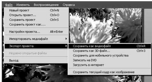
Рис. 8. Сохранение файла в различных форматах в видеоредакторе Movavi

• Дополнить ролик титрами: щёлкнуть по кнопке Титры , выбрать нужный вам вариант и перетащить его на дорожку, отмеченную буквой T . Дважды щёлкнуть внутри рамки в Окне просмотра и ввести свой текст.