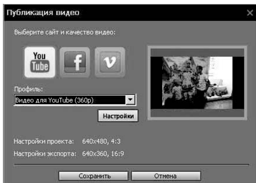
Рис. 9. Экспорт файла в видеоредакторе Movavi

• Сохранить видеоролик. Выбрать в меню Файл – Экспорт проекта – Сохранить как видеофайл . Выбрать нужный формат. Для загрузки видео в социальные сети или на YouTube подойдёт MPEG4 – универсаль-