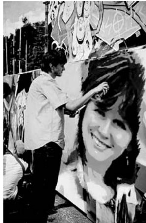
Рис. 1. Коллаж, созданный в Фотофании

Необходимо выбрать нужный шаблон для коллажа, подходящий эффект или фильтр и вставить свою фотографию. Многие фотоэффекты используют технологию распознавания лиц, поэтому получают такие коллажи, которые довольно сложно создать самостоятельно, даже обладая опытом работы в графических редакторах. Бесплатно, быстро, удобно.