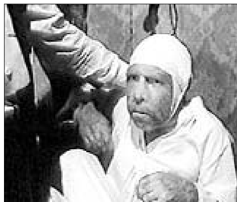
Кадр из х/ф «Собаچه сердце»

Это путь очеловечивания. Если же поощрять внешнюю расхлябанность (особенно в её прилатинском варианте), то со временем она станет внутренней и произойдёт расчеловечивание. Недаром синоним расхлябанности — расхристанность. И это обязательно рикошетом ударит по родителям и воспитателям. А они, как показывает опыт, не будут готовы к столь крутому повороту событий. Н