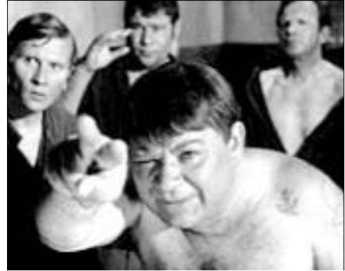
...пасть порву, моргалы выколю! Кадр из х/ф «Джентльмены удачи»

Хотя в чём-то они, конечно, будут похожи, поскольку обозначают жилище. Овладевая новым языком, человек хотя бы в какой-то мере усваивает и новое мышление, новую психологию. Иначе он будет механически, как попугай, повторять какие-то фразы, но не сможет по-настоящему понимать собеседников и будет попадать в нелепые ситуации.