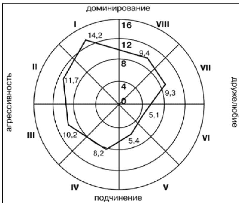
Рис. 4. Профиль направленности личности подростка по общему среднему баллу по каждой октанте «Идеального Я» для подростков первой группы