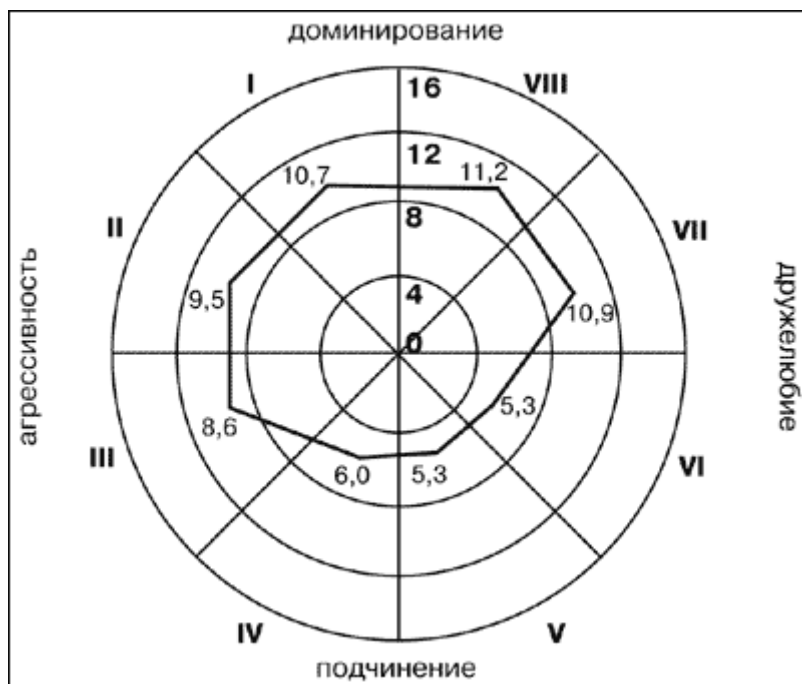
Рис. 6. Профиль направленности личности подростка по общему среднему баллу по каждой октанте «Ожидаемого Я» для подростков первой группы