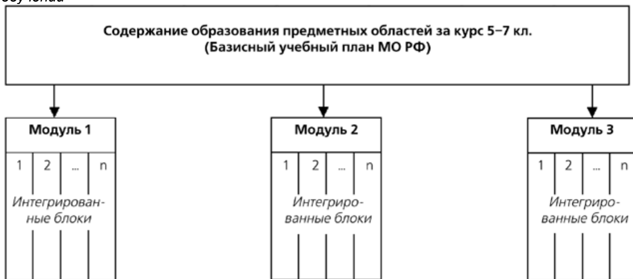
Схема 2. Организационная структура содержания образования при разновозрастном обучении

Для примера рассмотрим структуру содержания образования второй ступени предлагаемой модели малокомплектной сельской школы (схема 1). Каждая из модулей (схема 2) охватывает содержание учебного предмета, изучаемого в традиционной школе во всех классах (в нашем случае в 5–7 классах). Тем не менее, они отличаются друг от друга. Прежде всего, отличается угол зрения, под которым рассматривается содержание образования, применена другая расстановка акцентов, изменено соотношение практической и теоретической частей и т.д.