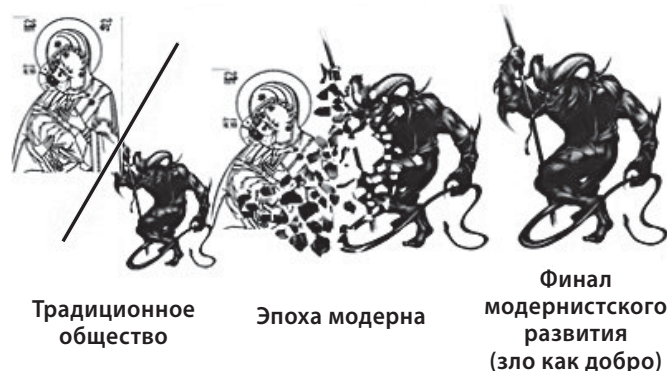
Рис. 2. Координаты добра и зла

щего все нравственные ценности традиционного общества. Глобализаторам для реализации их планов необходим новый человек, и он отнюдь не из традиционного общества. Идеологи глобализации это понимают, поэтому процесс переформатирования под нужного человека, в котором образованию отведена не последняя роль, начинался издавна. Вкратце этапы разрушения выглядят как закономерный переход из одного состояния общества в другое. Это традиционное общество, модерн и постмодерн. Как отмечает В.Э. Багдасарян, основные тенденции этого перехода проявлены в смене ценностно-мировоззренческой шкалы координат 25 . Сначала модерн создал некоего этического гибрида, в котором смешанное со злом добро утрачивает изначальную природу, а в постмодерне зло представлено как добро. В результате почти незаметно, под маркером добра реализуется проект планетарной универсализации зла. Исследователь констатирует: «Постмодернизм обнаруживает все признаки описанной в от-