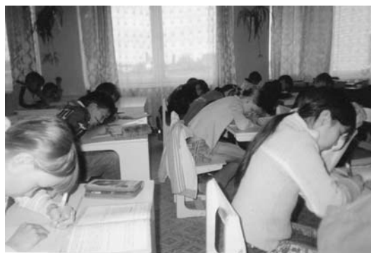
Эмбрионально-согбенная стресс-напряжённая поза учащихся в процессе письма