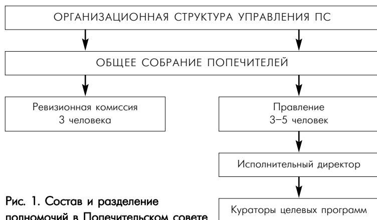
Рис. 1. Состав и разделение полномочий в Попечительском совете

образовательного учреждения, его ведущая функция — привлечь источники внебюджетного финансирования . Только те финансовые средства, которые привлёк, он и может контролировать, но не иные средства и тем более не бюджетные.