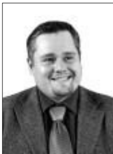
Игорь Реморенко, заместитель директора Департамента государственной политики в сфере образования Министерства образования и науки РФ

Чуть более года назад на заседании правительства были одобрены приоритетные направления развития образовательной системы РФ. Сейчас мы приступили к их реализации, имея существенный ресурс для поддержки тех, кто наиболее настроен на изменения в системе образования. Ведь в общей сложности впервые за всю историю постперестроечного образования в 6 раз увеличен ресурс развития отрасли.