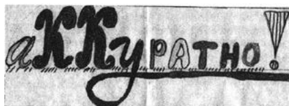
Фрагмент ученической тетради

А затем вывесить листок для всеобщего обозрения на стенку класса при помощи скотча. Стены наших классов постепенно скрываются под этими своеобразными обоями.