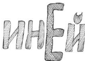
Фрагмент ученической тетради

Последовательность снятия слов не случайна. Её определяет история, которая сочиняется счастливчиком тут же, по ходу дела. Истории бывают притянуты за уши, но среди них встречаются и забавные. (Иногда, после ритуала снятия слов со стенки, я давала задание восстановить ту или иную историю, в соответствии с её ходом развешивая перепутанные листочки по местам. Это тоже работает на невольное запоминание.)