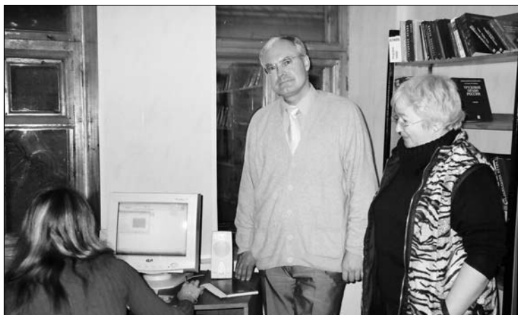
Публичный центр правовой информации в Ставропольской краевой библиотеке

Сегодня в отдалённых регионах, например, в Якутии, используется и активно развивается новая форма информационно-библиотечного обслуживания населения. Сначала по факсу или телефону собираются запросы из отдалённых мест по интересующим людей вопросам. Сотрудники библиотек готовят ответы на эти вопросы, а потом объезжают эти места и дают разъяснения по существу заданных вопросов и предлагают алгоритм решения стоящих перед конкретными людьми проблем. Библиотекам в их работе помогают специалисты-юристы или студенты юридических вузов в рамках юридических клиник. НО