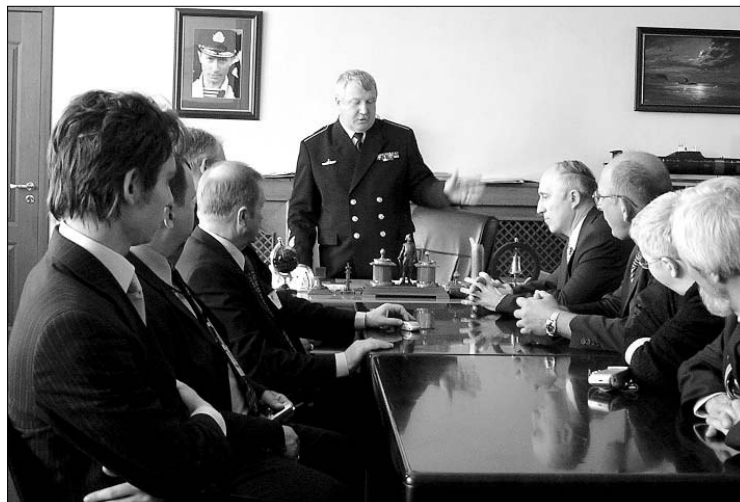
Открытие публичного центра правовой информации в Нахимовском военно-морском училище г. Санкт-Петербурга

В ПЦПИ регулярно проводятся практические занятия для повышения правовой грамотности пользователей