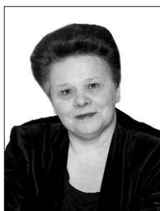
Галина Разбивная, министр образования и по делам молодёжи Республики Карелия

Размышления о региональной политике и некоторых итогах модернизации образования