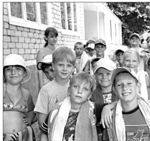
В лагерь приехала новая смена

Конечно, завоёвывать детские симпатии во многом помогает возраст наших вожатых: небольшой возрастной разрыв между ними и детьми, их открытость, искренность мотивируют детей к общению. Мы отказались от такой модели, в которой студенты-вожатые работают в паре с воспитателями-педагогами. За много лет я убедился: в лагере должны работать люди молодые, динамичные. Учитель-воспитатель старается изо всех сил, а ребята тянутся к вожатому, видят в нём одни достоинства, учителю же не прощают и малейших промахов. Может, потому, что учителя и здесь, в обстановке более неформального общения, никак не могут