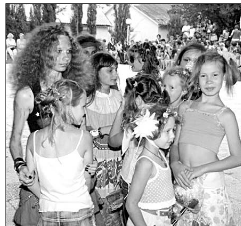
Предпраздничная лагерная кутерьма