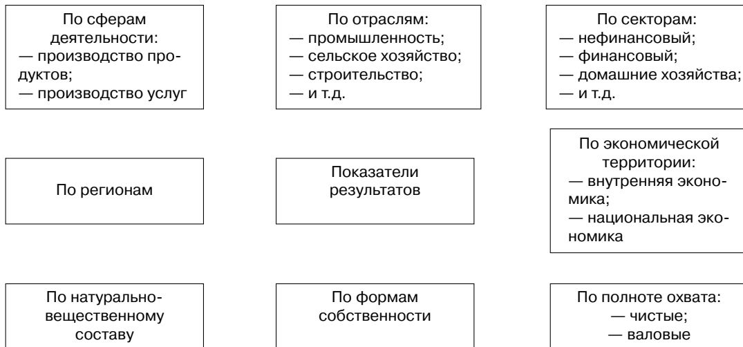
Рис. 1. Классификация макроэкономических показателей

Показатели результатов подразделяются на показатели валовых и конечных (чистых) результатов. В системе национальных счетов (СНС) валовые показатели отличаются от чистых на величину износа основного капитала (амортизации).