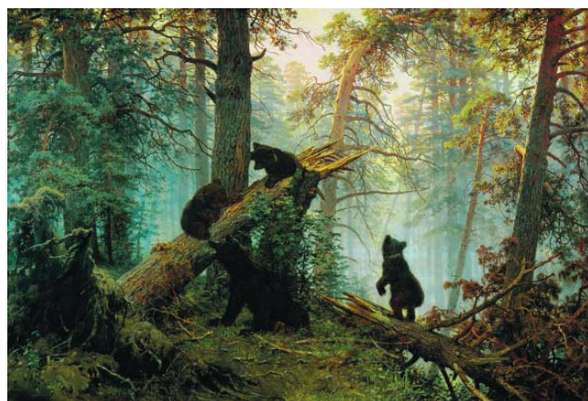
И.И. Шишкин. Утро в сосновом лесу

А вы уже видели эту картину, она вам знакома? Как она называется? Кто написал эту картину? (Ответы детей.)