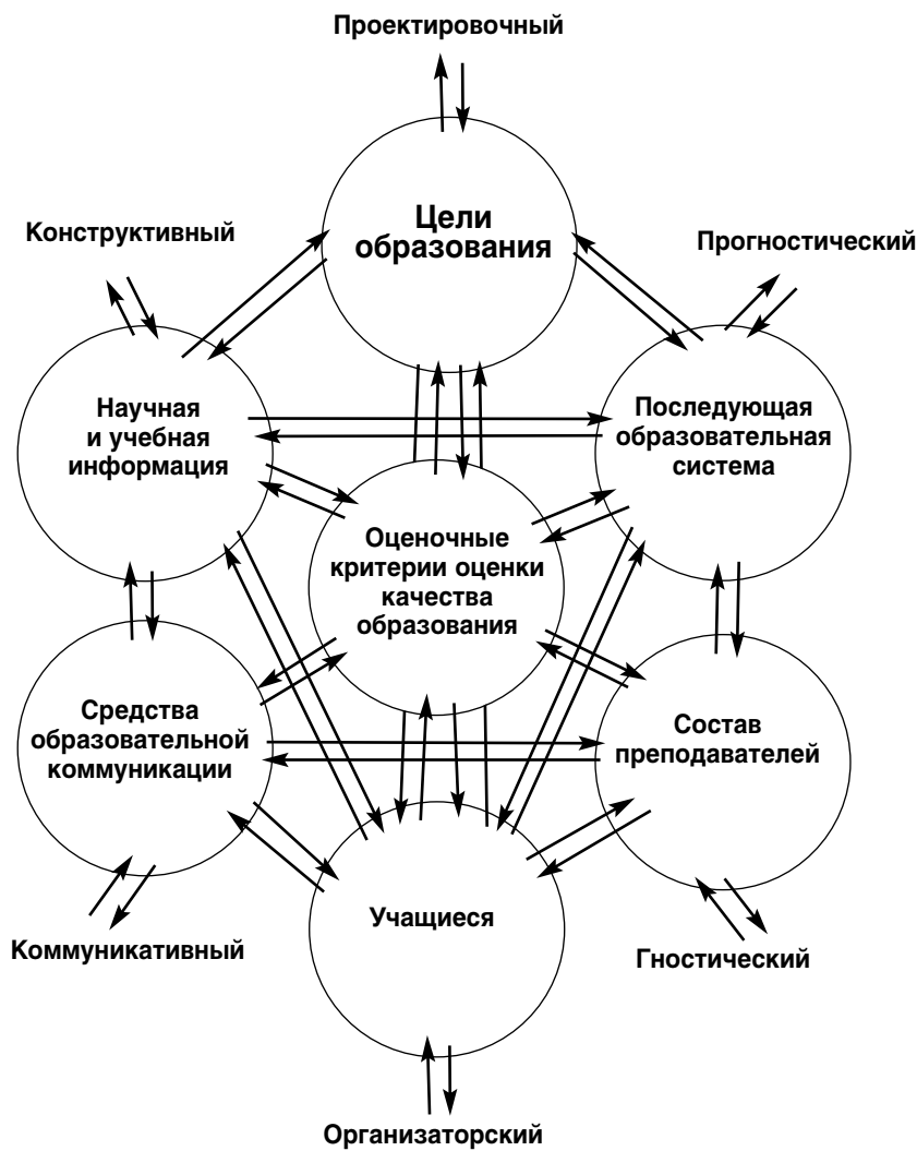
Рис. 2. Уточнённая модель взаимосвязи структурных и функциональных компонентов педагогической системы (по Н.В. Кузьминой)

простую структуру. Она разводит понятия структурных и функциональных компонентов: «Структурные компоненты — это основные базовые характеристики педагогических систем, совокупность которых, собственно, образует эти системы, во-первых, и отличает от всех других (непедагогических) систем, во-вторых» 6 . К ним принадлежат цели, учебная информация (содержание), средства педагогической коммуникации, педагоги и ученики. По мнению Н.В. Кузьминой, «названные компоненты необходимы и достаточны для создания педагогической системы. При исключении любого из них — нет системы» 7 .