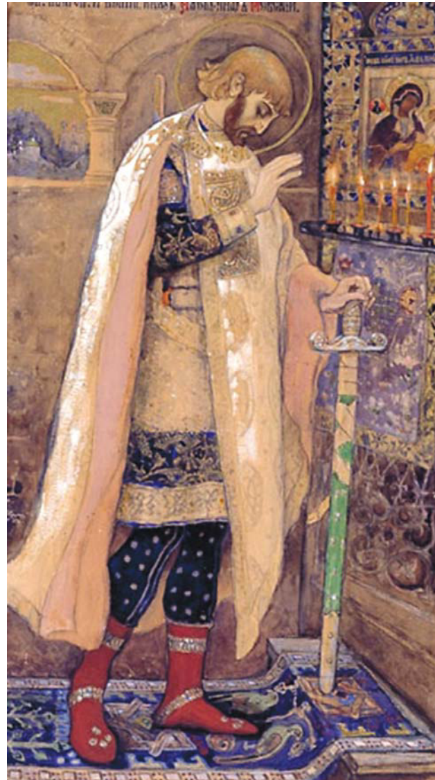
Михаил Нестеров. Князь Александр Невский

вольствием изучал походы Александра Македонского. Палочкой на снегу или земле чертил планы сражений Македонского. Стрелками обозначал удары войск и прикидывал, как бы он действовал сам.