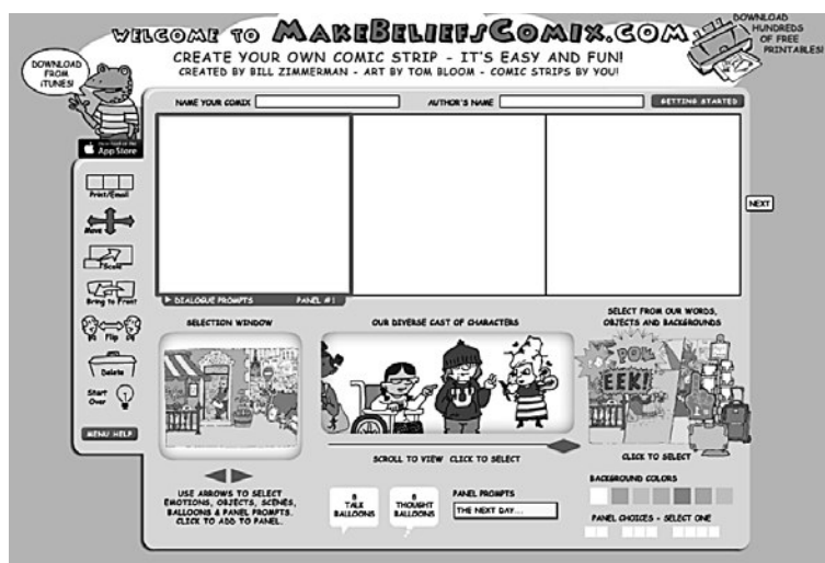
Рис. 1. Панель разработки комикса в сервисе MakeBeliefsComix

1. Создание автобиографической истории. В начале каждого нового учебного года школьники создают автобиографический комикс о себе и семье или суммирующий самые важные вещи о жизни.