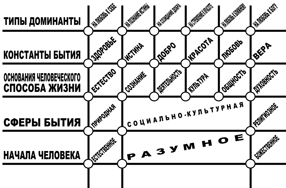
Рис. 1. Матрица взаимосвязи идеальных констант бытия, оснований человеческого способа жизни и типов доминанты

Основываясь на этой методологической матрице, в котором идеальные константы бытия занимают не последнее место, но при этом имеют ясный антропологический фундамент, выстроим некоторые теоретические педагогические конструкты, позволяющие более ясно и полно выстраивать педагогическую практику. Первый конструкт выстроим на понимании сути процессов в образовании.