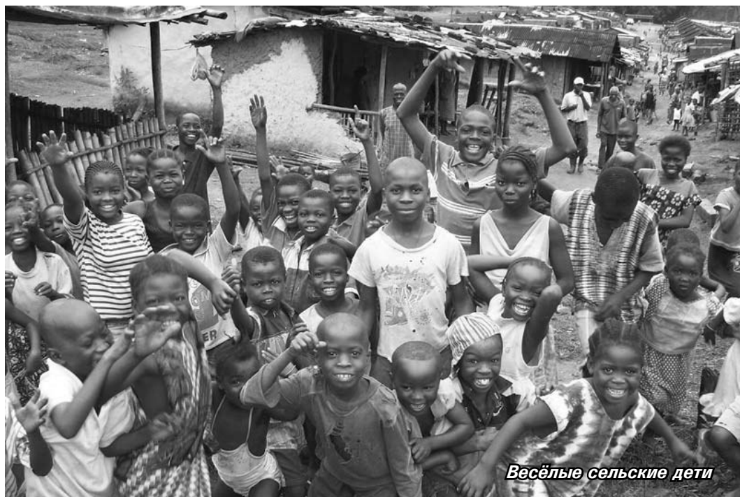
Весёлые сельские дети

С тех пор, когда я иду по деревне, я оглядываюсь на сельских детей.