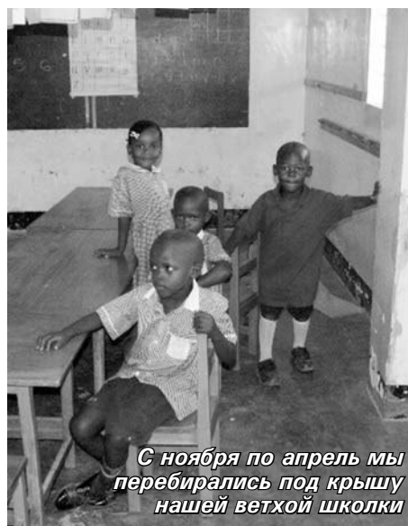
С ноября по апрель мы перебирались под крышу нашей ветхой школки

С тех пор я больше не обсуждаю эту тему и стараюсь не задавать детям глупые вопросы.