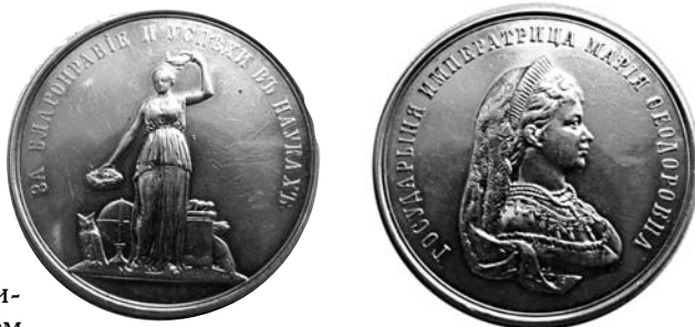
Рис. 7. Медаль «За благодетелья и успехи в науках» для лучших выпускниц женских гимназий

Сегодняшняя школа как элемент сферы потребления (а не как стратегический социальный институт) заниматься возвращением прилежания и благодетелья точно не будет. Ибо ни прилежание, ни благодетелья нельзя предоставить и потребить как услугу. Знания, умения и компетентности можно потребить, а вот любознательность, трудолюбие, усердие и старательность ни предоставить, ни потребить нельзя. Их возвращать надо, а сфера услуг этим не занимается. Поэтому школа (как сфера услуг), стоящая в один ряд с химической и парикмахерской, будет по-прежнему законно (то есть согласно госстандарту) плодить в лучшем случае знающих лентяев, умеющих циников, компетентных подлецов и адаптированных хитрецов. А по окончании, видимо, будет награждать «лучших» выпускников медалью «За компетентность и адаптированность». И мы будем дальше строить граждан-