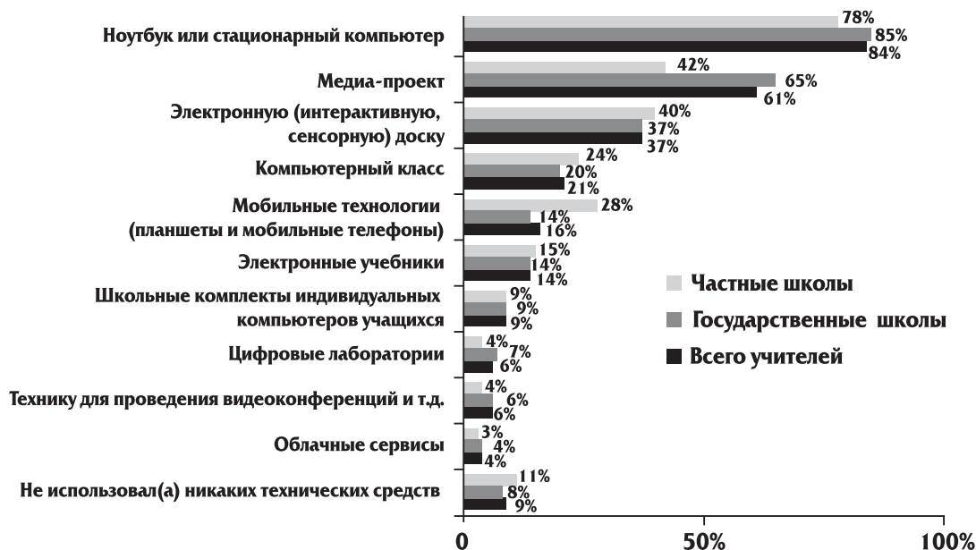
Рис. 6. Технические средства, которые использовали в прошлом учебном году в ходе своих занятий учителя, 2014 г. (в процентах от численности опрошенных)

Несмотря на рост заработной платы, сохраняется разрыв между текущей