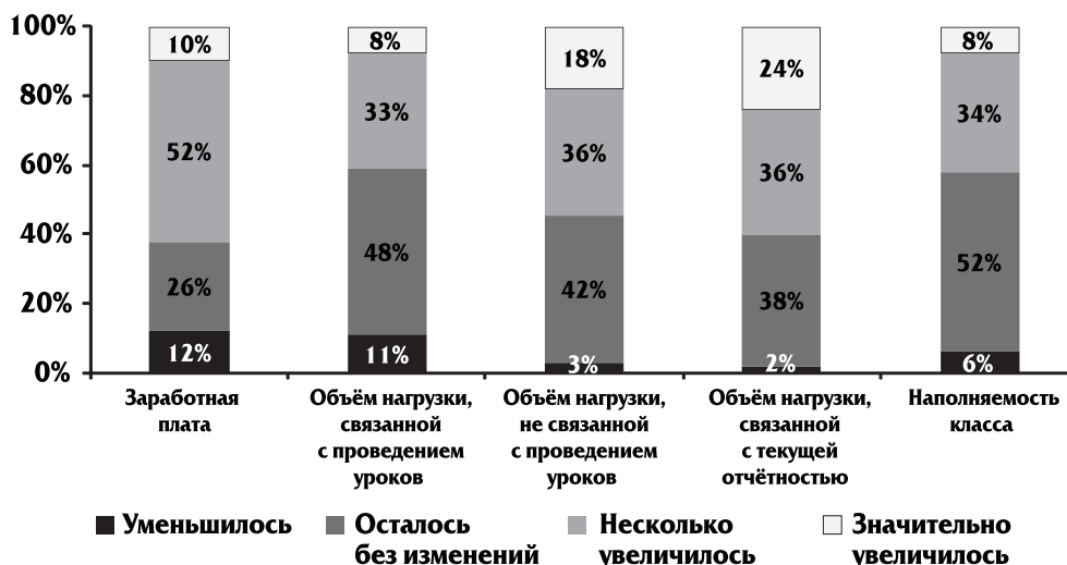
Рис. 2. Изменения в условиях деятельности учителей за последние два года, 2014 г.

Очень важный блок вопросов относился к изменениям, которые произошли в условиях деятельности учителей, в школьном климате и в положении учителей внутри школы за последние два года. Результаты ответов учителей представлены на рис. 2.