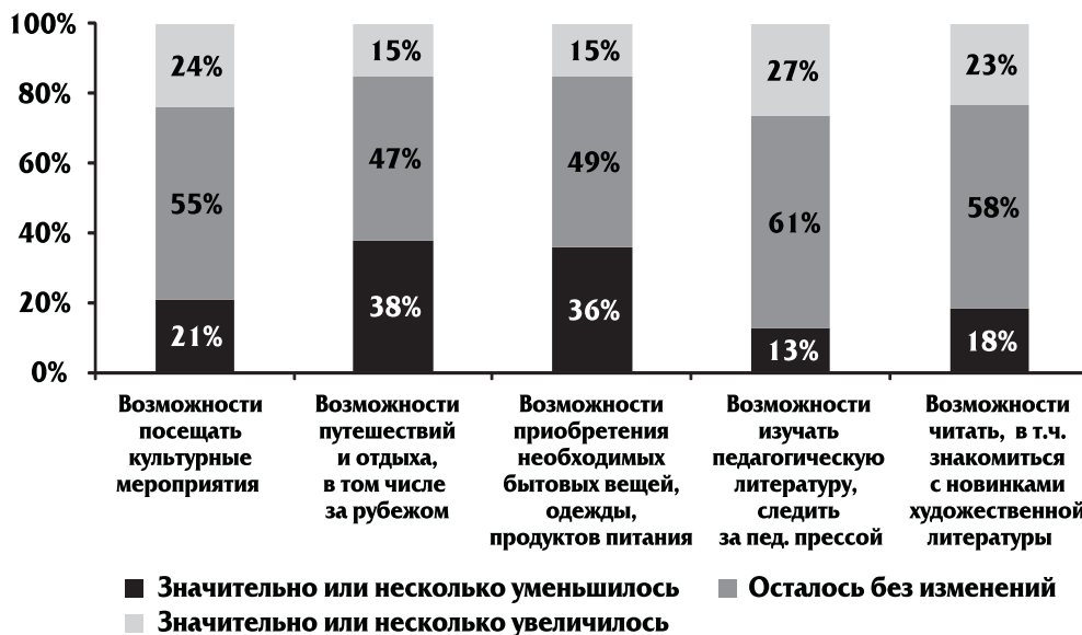
Рис. 4. Изменения положения учителей за последние два года, 2014 г. (в процентах от численности опрошенных)

Более 24% опрошенных учителей считают, что навыки работы в области компьютерных и информационных технологий являются главным дефицитом, который препятствует эффективной работе. Интересными представляются различия