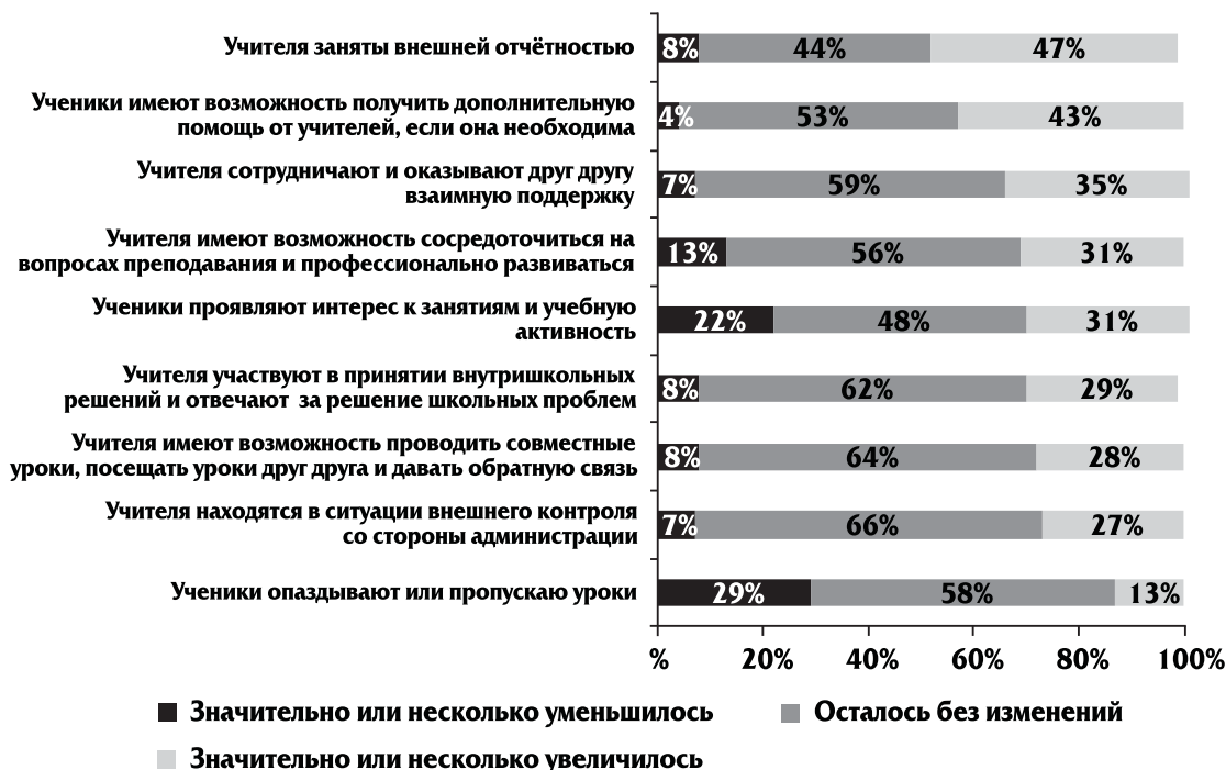
Рис. 3. Изменения в условиях работы учителей за последние два года, 2014 г.

Учителям также предлагалось оценить изменения по ряду параметров, которые характеризуют школьный климат. Ответы учителей соотносятся с ответами на предыдущий вопрос: мы видим, что вовлечённость учителей в работу, связанную с внешней отчётностью, увеличилась для 47%. Около 44% сказали что этот вид занятости остался без изменений, 43% учителей отметили рост возможности учеников получить дополнительную помощь от учителя, если она им необходима. Треть учителей (29%) ответила, что опоздание и пропуски уроков значительно или несколько уменьшились, но при этом 22% отметили снижение интереса учеников