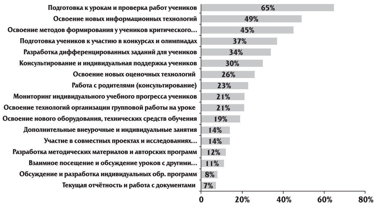
Рис. 5. Что учителям считают в данный момент наиболее важным для своей работы, 2014 г.

Второе по популярности средство — медиа-проектор, который использовали больше половины опрошенных учителей, а треть (отметило больше трети учителей) — электронная (интерактивная) доска. Такие средства, как мобильные технологии и электронные учебники, используются существенно меньшим числом учителей, но уже достигнутый уровень (16% и 14% соответственно)