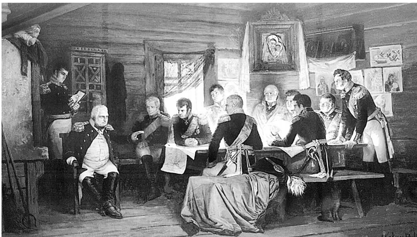
Военный совет в Филях в 1812 году. Худ. А.Д. Кившенко.

В ближайшие дни сложил оружие корпус Нея в 12 тысяч человек со всей артиллерией, казной и т. п. Маршал Нея ушёл с несколькими сотнями человек. Перебитых и утонувших при переправе через реку не считать. Это был разгром в полном смысле слова. Кутузов ещё