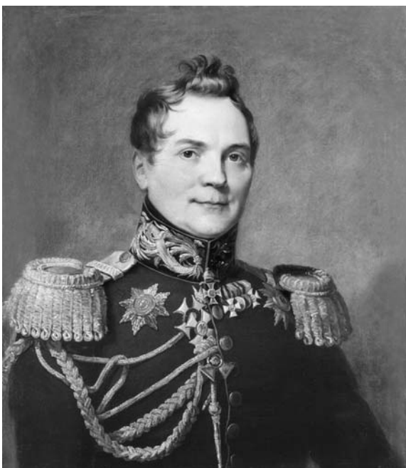
Карл Фёдорович Дуз Джордж Толь

Первая, противостоявшая французскому ополчению, одинокому, без союзников и без Наполеона, сотрясла налагаемое на неё иго при помощи огромных денежных капиталов и многочисленной армии союзной с нею Англии. Последняя, принявшая на свой щит удары того французского ополчения, но усиленного восставшим на неё всем Западом, которым предводительствовал и управлял сам Наполеон, —