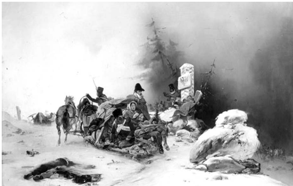
Отступление французов из России. Худ. Б.П. Виллевальде. 1846 г.

Генерал Жомини, в последнем своём сочинении [5] заставляет говорить Наполеона: «Главные причины неудачного предприятия на Россию относили к ранней и чрезмерной стуже; все мои приверженцы повторяли эти слова до пресыщения. Это совершенно ложно. Как подумать, чтобы я не знал о сроке этого ежегодного явления в России!.. Не только зима наступила не ранее обыкновенного, но приход её 26-го октября ст. ст. был позже, нежели как это ежегодно случается. Стужа не была чрезмерна, потому что до Красного она изменялась от трёх до восьми градусов, а 8-го ноября наступила оттепель, которая продолжалась до самого прибытия нашего к берегам Березины: один только день пехота могла переходить по льду чрез Днепр, и то до вечера; вечером оттепель снова повредила переправу. Стужа эта не превышала стужи Эйлавынской кампании: в последней громады конницы носились по озёрам, покрытым