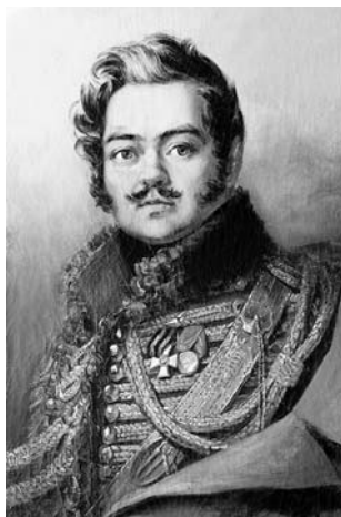
Денис Васильевич Давыдов

Кому в России неизвестно имя блистательного гусара, партизана, поэта? Давыдов был мальчишкой, когда Суворов благословил его на воинские подвиги. «Имя моё во всех войнах торчит, как казацкая пика», — острил Денис Васильевич. Но его послужной список впечатляет! Он был адъютантом Багратиона — а значит, сражался там, где опаснее. Он предложил план партизанской войны и командовал партизанским отрядом, наводившим ужас на врага. После наполеоновских войн защищал честь империи в сражениях с поляками и персами. Закончил воинскую службу в чине генерал-лейтенанта. А ещё он вошёл в историю литературы как талантливый поэт пушкинской плеяды, как патриот, воевавший с русофобами не только саблей, но и пером. Военные записки Дениса Давыдова бесценны как историческое свидетельство, как пример просвещённого и страстного патриотизма. Читать его — одно удовольствие.