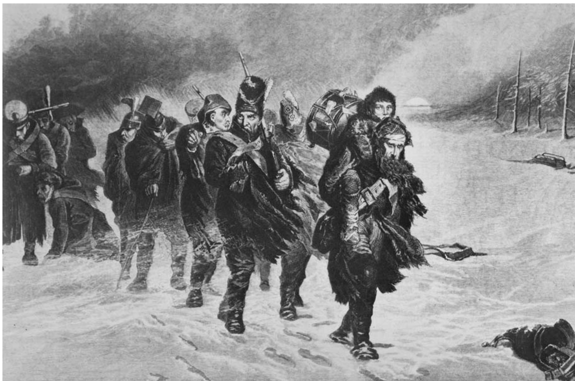
Отступление французской армии из России в 1812 году. Ксилография по оригиналу Л. Потта.

В двадцать пятом бюллетене признана необходимость зимних квартир, и император представлен с видом самодовольствия осмат-