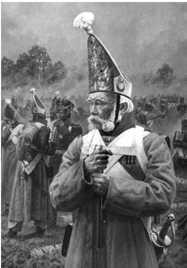
Ветеран. Худ. А.Ю. Аверьянов. 1999 г.