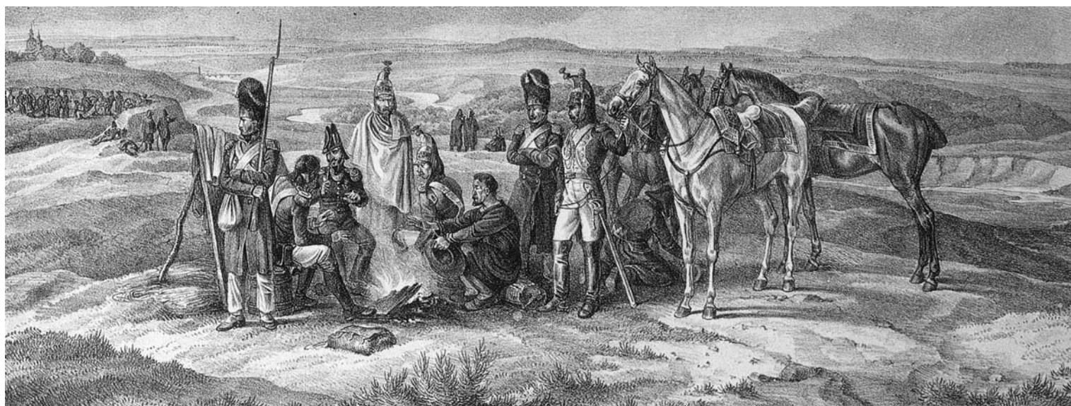
Около Бородина. 6 сентября 1812 г. Литография по рисунку А. Адама. 1830-е гг.

Генерал Дохтуров, личный свидетель подвигов Измайловских и Литовских каре, загнанный бурей скачущей отовсюду конницы, сам вверил себя одному из этих каре, каре 1-го батальона, и отстоялся в нём. Три генерала, и между ними король и вице-король, как мы видели, должны были скрываться в каре: вице-король в каре 84-го, Дохтуров в каре Измайловском, король Неаполитанский в каре 33-го полка. По этому судите о бурях и случайностях Бородинского сражения! Маршалы призадумались; но не отстали от своего намерения и продвинулись вперёд.