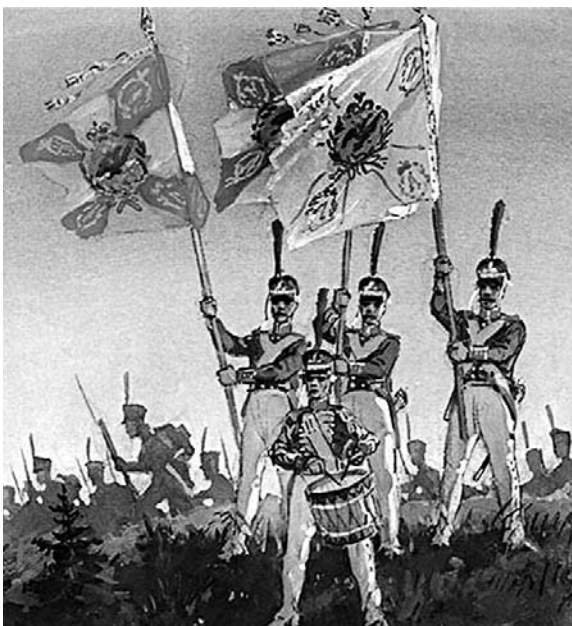
26 августа 1812 г. Худ. В.Г. Шевченко. 1970 г.

Если следовать логике рассуждений до конца, не боясь выводов, то следует признать, что отказ от службы по призыву и её полная замена воинской службой по контракту неминуемо приведут к разрушению национального самосознания граждан России, утрате ими основополагающих качеств патриотов и защитников своего национального Отечества.