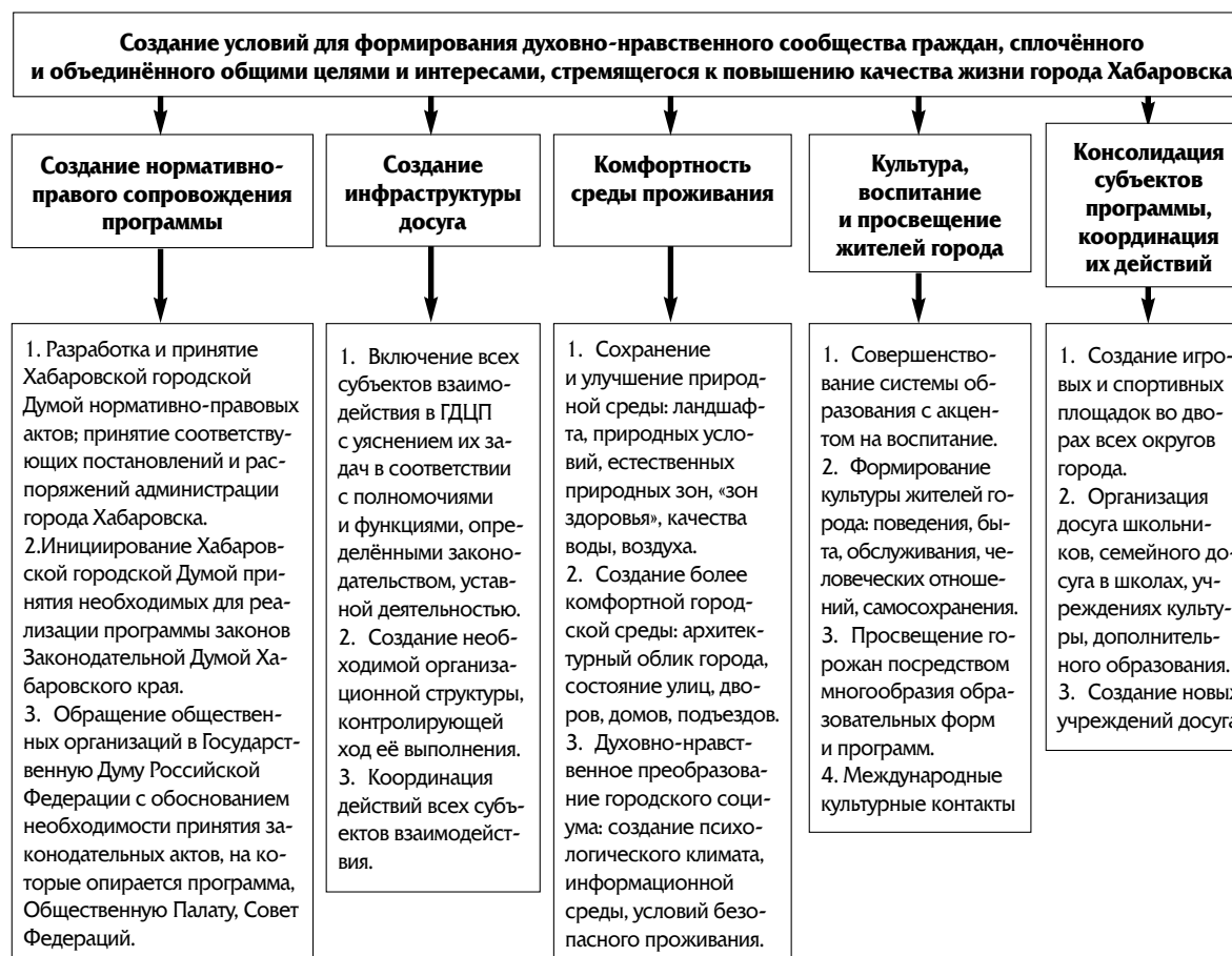
Схема 2. Задачи программы

Каждое направление имеет свои задачи в том или ином сегменте духовно-нравственного поля, решение которых предполагает конкретные результаты.