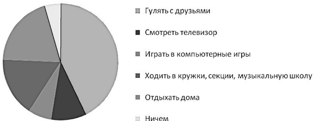
Рис. 1. Распределение интересов в свободное время

В XXI веке при видимой широте выбора развлечений и занятий по интересам подростки выбирают между компьютерными играми, прогулками с друзьями и просмотром телевизора. В 2008/09 учебном году проводился комплексный социологический мониторинг среди учащихся средней и старшей школы № 1474 Москвы. Один из вопросов мониторинга звучал так: «Чем вы любите заниматься в свободное от учёбы время?». В результате были получены вполне ожидаемые результаты, которые отражены в диаграмме «Распределение интересов в свободное время»: