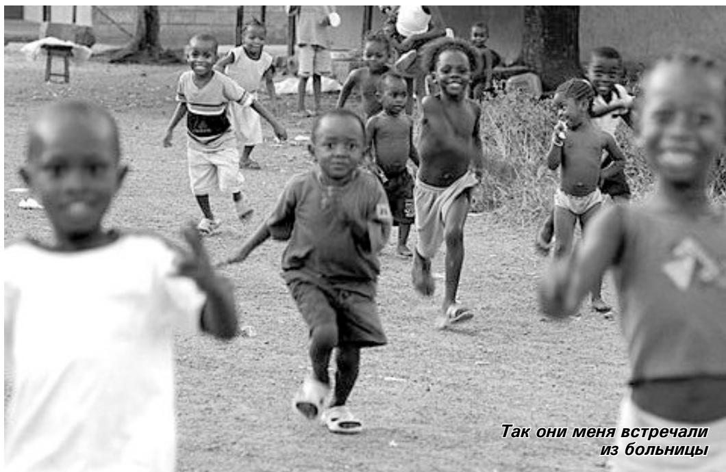
Так они меня встречали из больницы

С тех пор я с великой осторожностью подбираю сказки для уроков чтения.