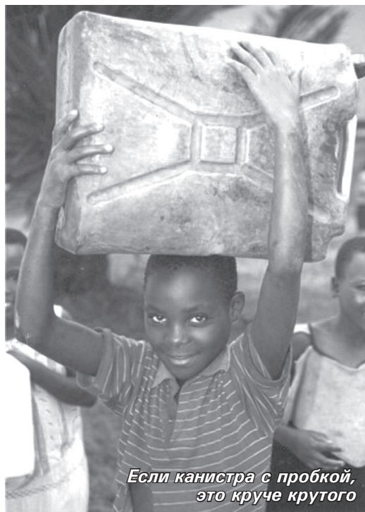
Если канистра с пробкой, это круче крутого

Бунта мог с канистрой делать всё. Мог в неё дуть, извлекая глухой трубный звук. Мог нести её на голове без рук и даже прыгать при этом. Мог выстукивать ритмы так, что все пускались в пляс. Мог сидеть на канистре. Мог зажать её между колен и бежать наперегонки, в чём ему не было равных.