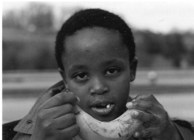
Африканские дети рады банановой диете

После этого разговора я очень аккуратно стал рассказывать африканским детям про Россию, больше рассказывал про людей и меньше про вещи.