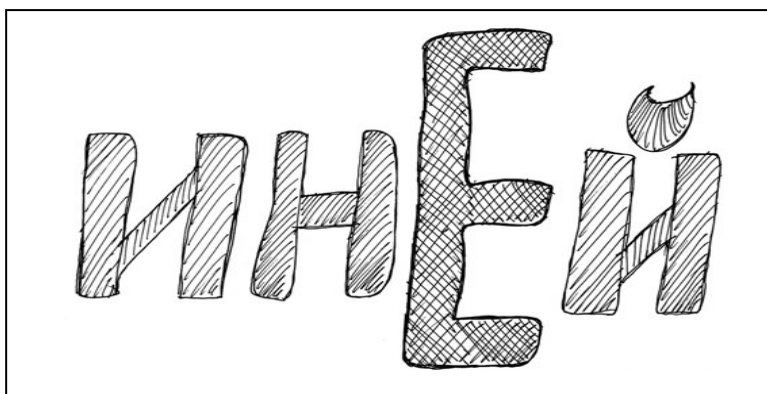
Слово со «стенки»

источник. Другой (столь же неистощимый, но черпаешь из него уже в средней школе) – это тетрадки по предметам, требующим конспектирования (истории, географии и так далее). Я их периодически собираю и проверяю. Появившаяся на полях (конечно, наряду с другими) цифра 6 обязывает ученика действовать согласно вышеуказанной инструкции. Вот вам и куча словарных слов, причём каждое – из персонального словаря учащегося!