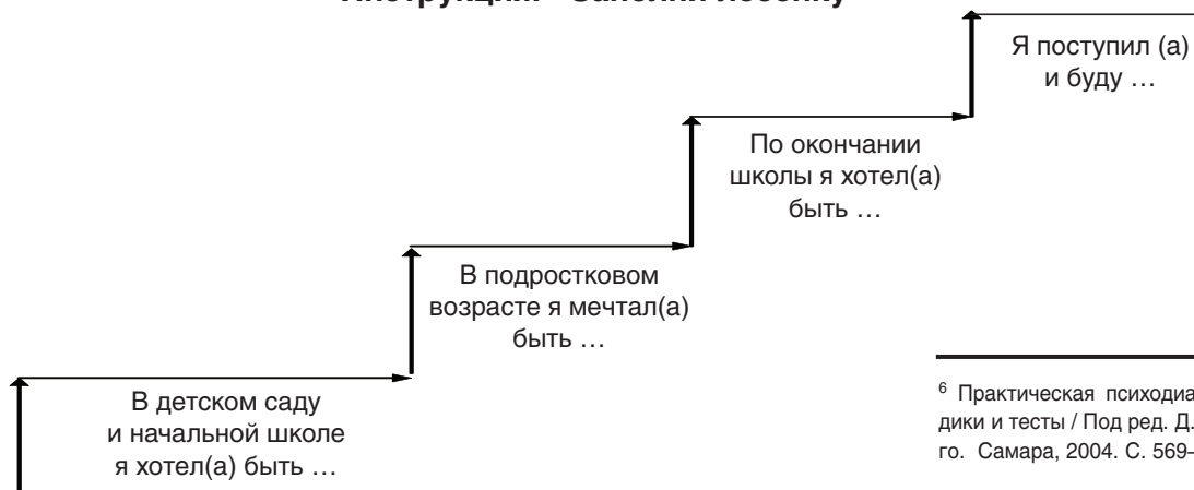
Рис.1. Опросник «Лесенка профессиональных планов»