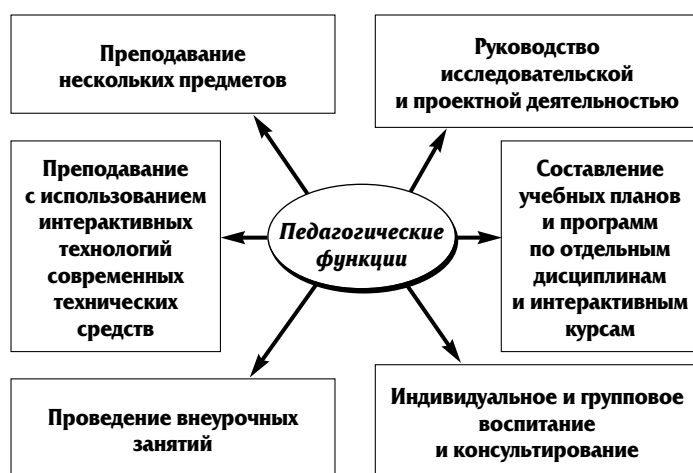
Рис. 1. Педагогические функции в современных образовательных моделях

Очевидно, что в условиях реализации современных образовательных моделей объективно