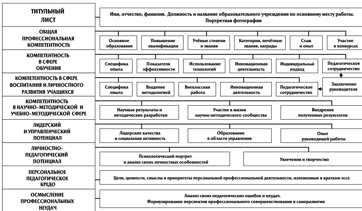
Рис. 3. Модель портфолио для педагогического персонала образовательных учреждений

ние о содержании профессиональной компетентности учителя, как совокупности общих педагогических и управленческих способностей, основанных на знаниях, опыте, ценностях и склонностях (табл. 2). Педагогическая компетентность рассматривается как совокупность индивидуальных навыков в образовательной сфере, в сочетании с инициативностью, адекватным социальным поведением, эффективной коммуникацией, способностью сотрудничества и преодоления конфликтов в групповой деятельности. Педагогическая компетентность включает не только когнитивную и операционально-технологическую, но и мотивационную, этическую, социальную и поведенческую составляющие. Она включает результаты профессионального образования, систему ценностных ориентаций. Многофункциональность и многомерность педагогической компетентности позволяют решать различные профессиональные и социальные проблемы, актуализируя различные психологические процессы и механизмы. НО