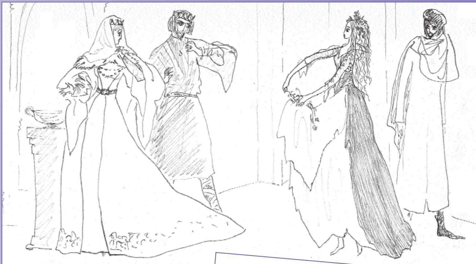
Королева, король, Гамлет и Офелия, потерявшая рассудок. 1967