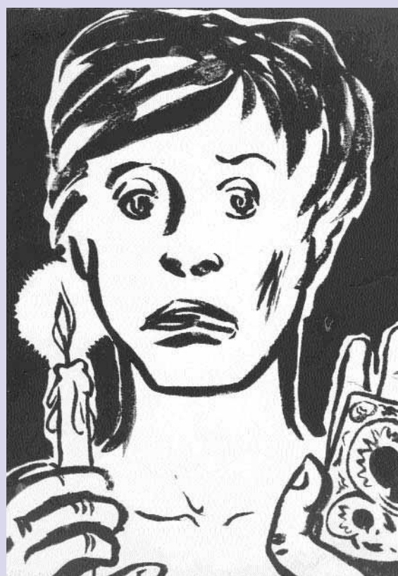
Иван Бездомный входит в МОССОЛИТ. 1968

Рушевой всех нас сделала беднее. Прошло тридцать лет и три года, и сегодня яснее, чем прежде, что с уходом таких светящихся, зажженных людей, как Надя, мы потеряли мечту. И все-таки когда-нибудь рисунки Нади снова оживут, снова станут необходимыми для тысяч равнодушных людей. Надежду дает нам лучший московский школьный музей. Между прочим, таков и девиз музея — «Надежда есть!».