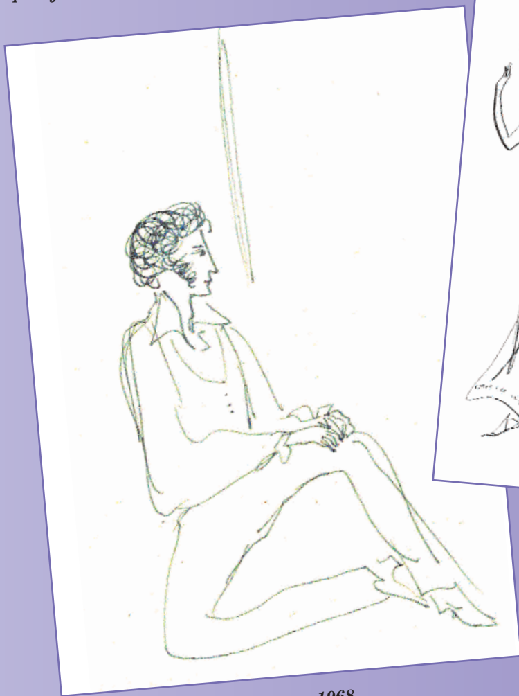
Сизу за решеткой. Вариант. 1968