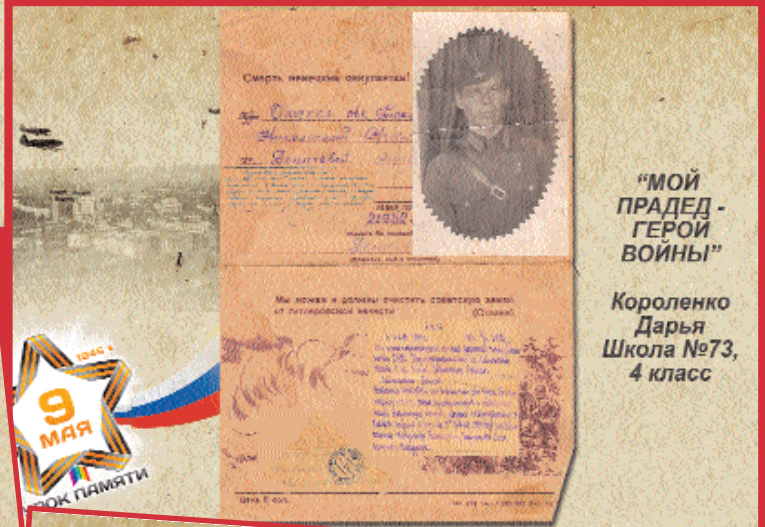
“МОЙ ПРАДЕД - ГЕРОИ ВОЙНЫ”