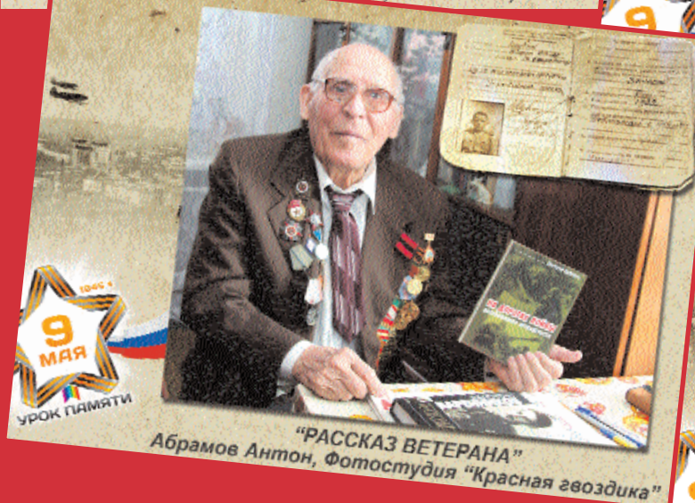
“РАССКАЗ ВЕТЕРАНА” Абрамов Антон, Фотостудия “Красная звезда”