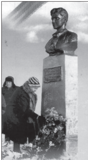
Тамбовская область. Осино-Гай. Бюст Зои Космодемьянской. Скульптор С. Лебедев. Установлен в 1957 г.