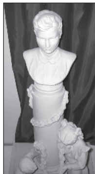
Петрищево. Музей Зои Космодемьянской. Скульптор Н. Рождественская