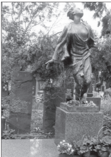
Скульптура-надгробие. Архитектор Н.И. Комова, скульптор — народный художник РСФСР О.К. Комов. Открытие памятника состоялось 29 октября 1986 года