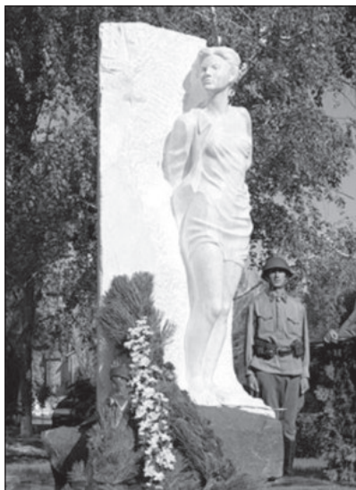
Волгоград. Памятник Зое Космодемьянской у здания школы № 130. Белый мрамор. Скульптор народный художник РФ В.Г. Фетисов. Установлен в 2008 г.