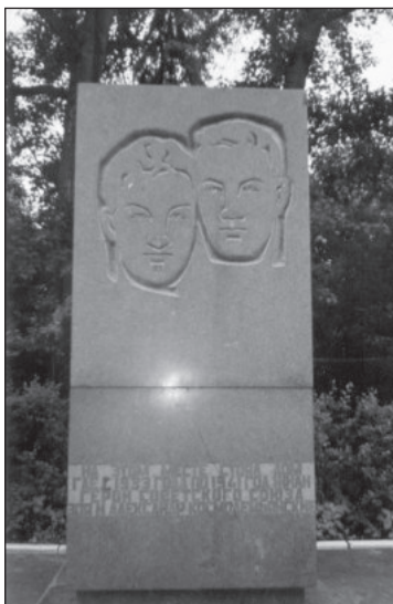
Стела на месте дома, где жили Космодемьянские с 1933 по 1941 гг. Скульптор С.А. Лойк, архитекторы С.Г. Деминский, Ю.Ю. Успенский. Установлена в 1969 г.