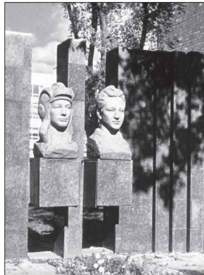
Мемориальный комплекс здания школы № 201. Бюсты Зои и Александра Космодемьянских. Гранит. Архитектор К.С. Шехоян, скульптор О.А. Иконников. Установлен в 1981 году.