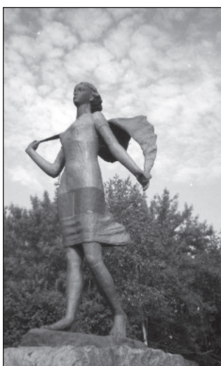
Памятник Зое Космодемьянской. Скульптор М. Салычев. Установлен в 1995 г.