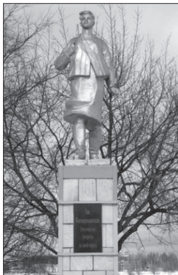
Рыбинск. Скульптор Борис Широков. Надпись на постаменте: «Зоя Космодемьянская «Это счастье умереть за свой народ»»