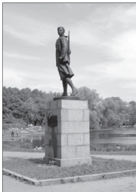
г. Санкт-Петербург, Московский парк Победы. Памятник работы М.Г. Манизера установлен в 1951 г.