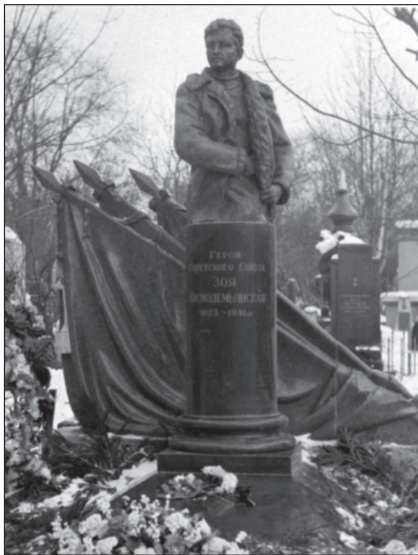
Первый памятник на Новодевичьем кладбище был открыт 2 февраля 1954 г. Скульптор Е.А. Рудаков. На чёрной гранитной колонне надпись: «Герой Советского Союза Зоя Космодемьянская, 1923–1941», сзади высеченные из красного гранита склонённые знамёна