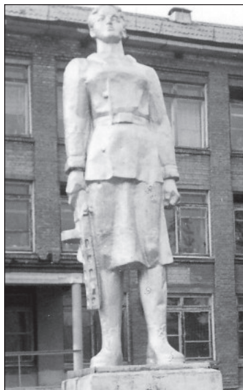
Город Бердск Новосибирской области. Памятник Зое Космодемьянской у школы № 11. Открыт в 1975 году.