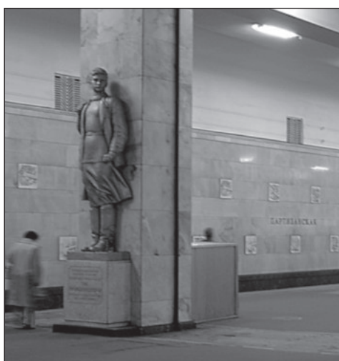
Москва. Станция метро «Партизанская». Скульптура работы М.Г. Манизера установлена в 1944 году, на постаменте надпись: «Посвящается легендарной партизанке-разведчице, Герою Советского Союза Зое Космодемьянской, погибшей 29 ноября 1941 года при защите Москвы»

Первая скульптура Космодемьянской установлена в 1944 году в вестибюле метро, тогда — «Измайловская» (позже —