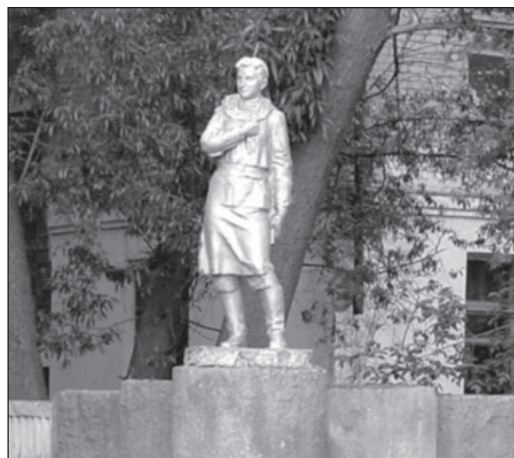
Город Копейск Челябинской области. Скульптор народный художник СССР Е.В. Вучетич (Москва), архитектор М.Г. Сеиенов (Копейск), мастер-лепщик В. Сергиенко (Копейск). Скульптура из цемента с мраморной крошкой, окрашена. Установлена в 1964г. у здания средней школы № 42.

Оказывается, на заработанные деньги за сданный металлолом и с помощью родителей и шефов в 1975 году был торжественно открыт памятник Зое Космодемьянской. С того времени ежегодно в школе проводятся дни памяти героини — 13 сентября и 29 ноября.