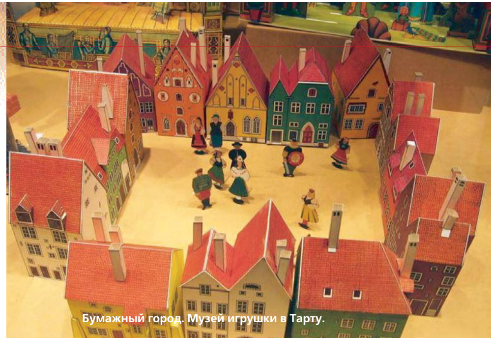
Бумажный город. Музей игрушки в Тарту.