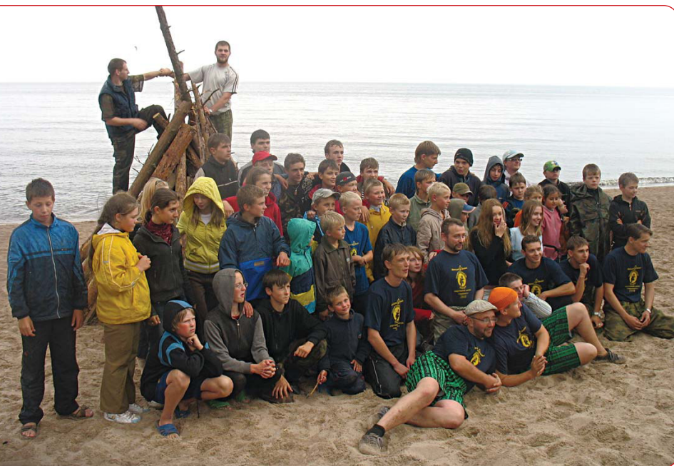
На Ладоге. Лагерная смена 2008 года

ориентирована на всё мужское население, а для эффективного стимулирования мужчин разбираться в этом должны были и женщины. Вот так и образовалось это триединство ориентиров традиционной русской культуры — труд, религия и бой с целевой направленностью укреплять устойчивость, наращивать потенциал, повышать эффективность его применения, а вместе это и означает прогресс.