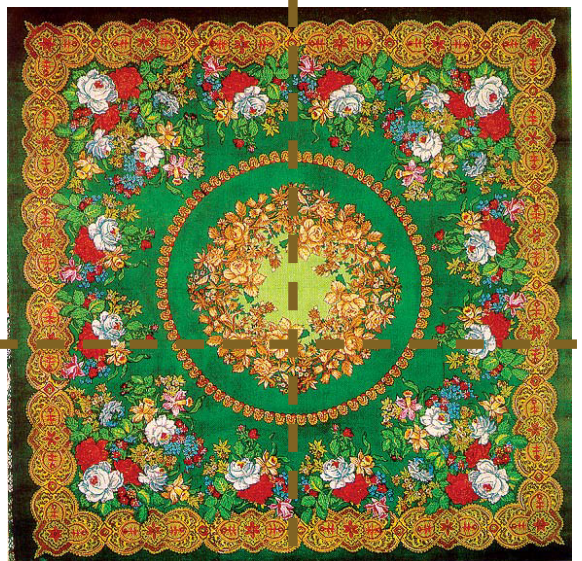
ПАВЛОВО- ПОСАДСКИЕ ПЛАТКИ