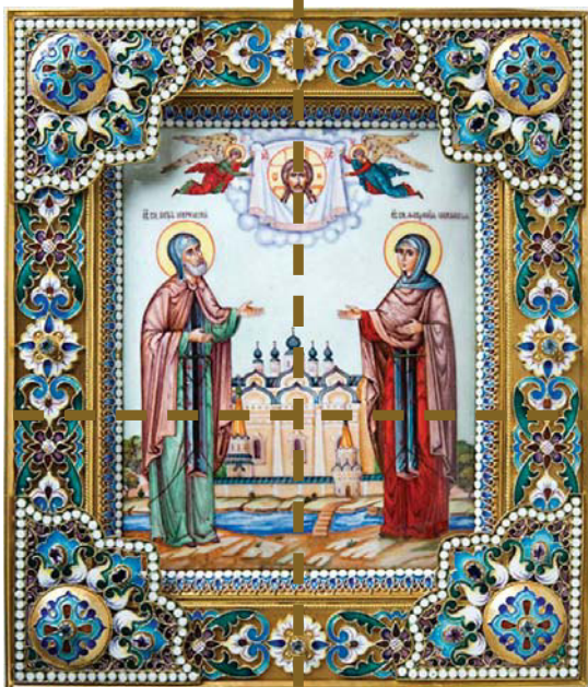
ФИЛИГРАНЬ И ФИНИФТЬ