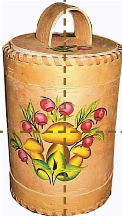
ИЗДЕЛИЯ ИЗ БЕРЕСТЫ