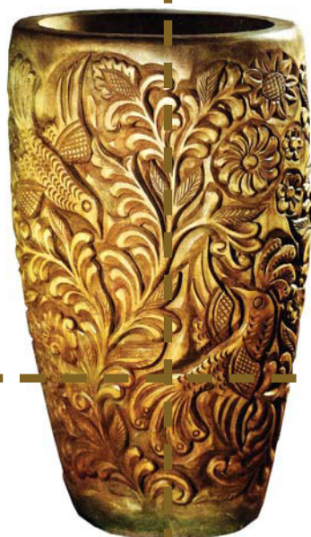
АБРАМЦЕВО- КУДРЕНСКАЯ РЕЗЬБА