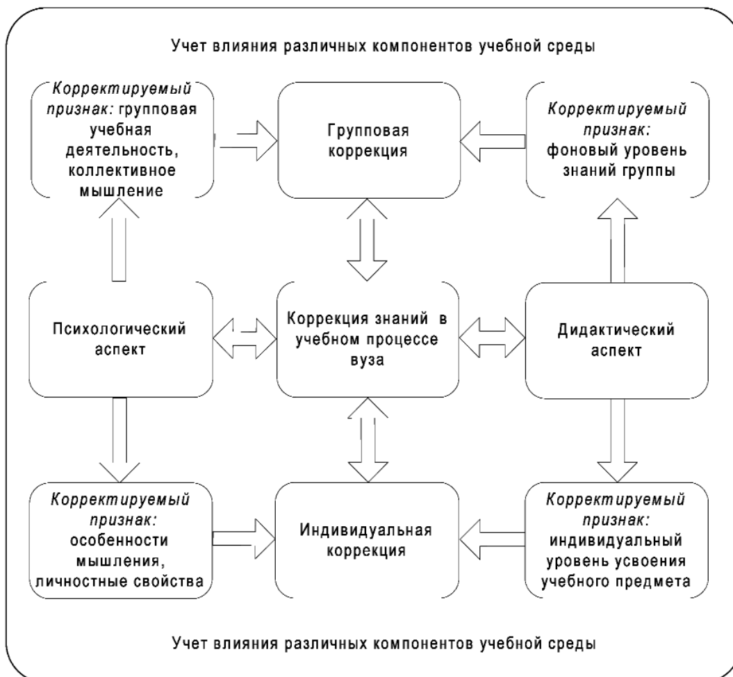
Рис. 2. Структурная модель коррекции знаний в учебном процессе вуза

Изучение связи педагогической диагностики и коррекции знаний, анализ эффективности средств коррекции знаний, попытка понять механизмы коррекции знаний в психологическом и дидактическом аспектах позволили автору статьи разработать диагностико-коррекционный метод, нацеленный в большей степени на само / взаимодиагностику, само / взаимокоррекцию знаний — тест коррекции знаний . Он