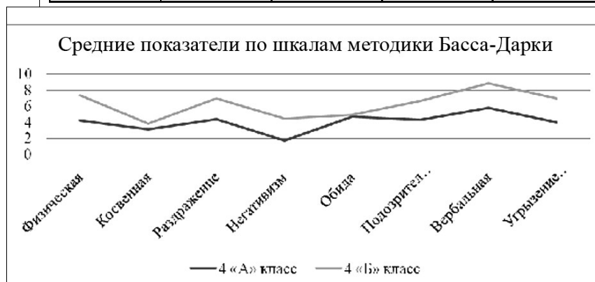
Рис. 1. Средние показатели по шкалам методики Басса-Дарки