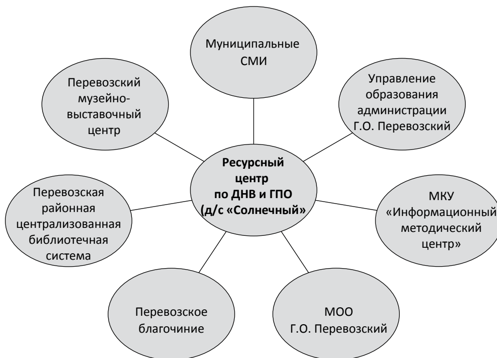
Рис. 2. Система межведомственного взаимодействия ресурсного центра по духовно-нравственному воспитанию и гражданско-патриотическому образованию