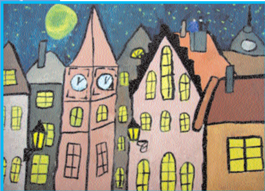
Иллюстрация к сказке «Пастух и пастушка». Павел Баруткин, 7 лет