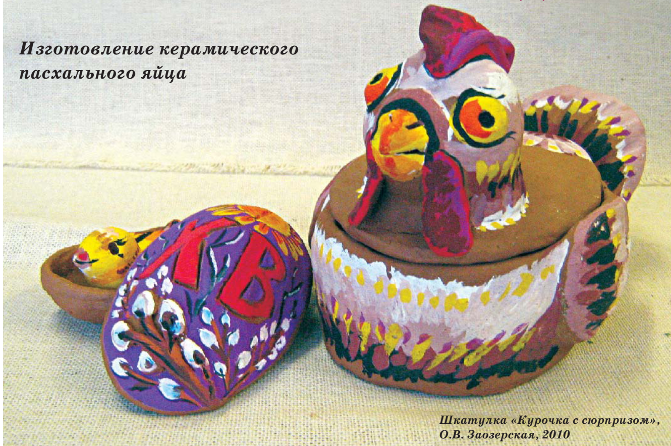
Шкатулка «Курочка с сюрпризом», О.В. Заозерская, 2010

Изготовление керамического пасхального яйца