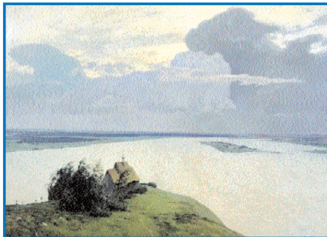
Исаак Левитан. Над вечным покоем. 1894

«Художник изобразил красоту осени. Используются звонкие теплые цвета — желтый, красный, багряный. Нет ожидания чего-то злого, нет резких линий. Очень хочется там побывать — мягко и спокойно!»