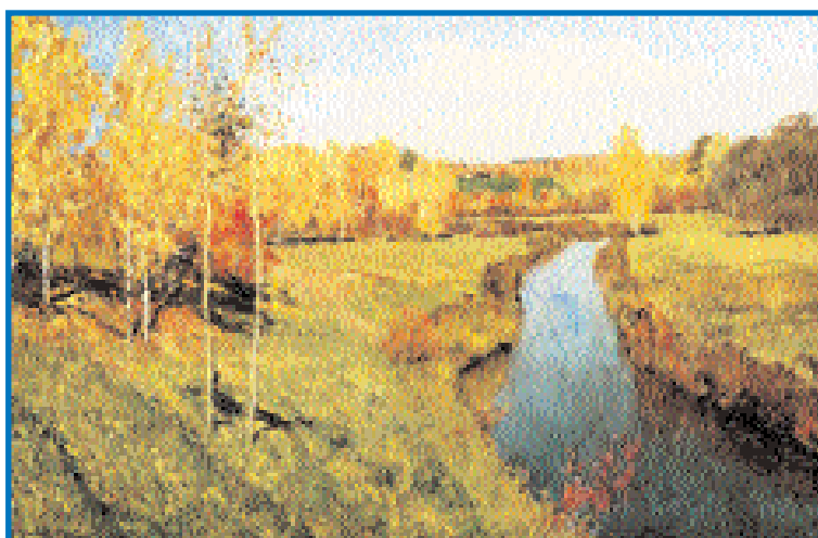
Исаак Левитан. Золотая осень. 1895

«На этой картине я вижу темные тучи, которые закрывают солнце. Стало темно, и земля потускнела. Вот-вот пойдет сильный ливень. И художнику, и мне очень грустно и страшно. Но вот что-то сверкнуло в небе. Наверное, это молния. Но нет! На молнию это не похоже. Это радуга! Она выросла над тучей. И мне, и художнику уже не страшно. А наоборот, светло и весело. И тучи начинают пропадать вместе с плохим настроением. Эта картина мне очень понравилась, она вызвала у меня очень много эмоций».